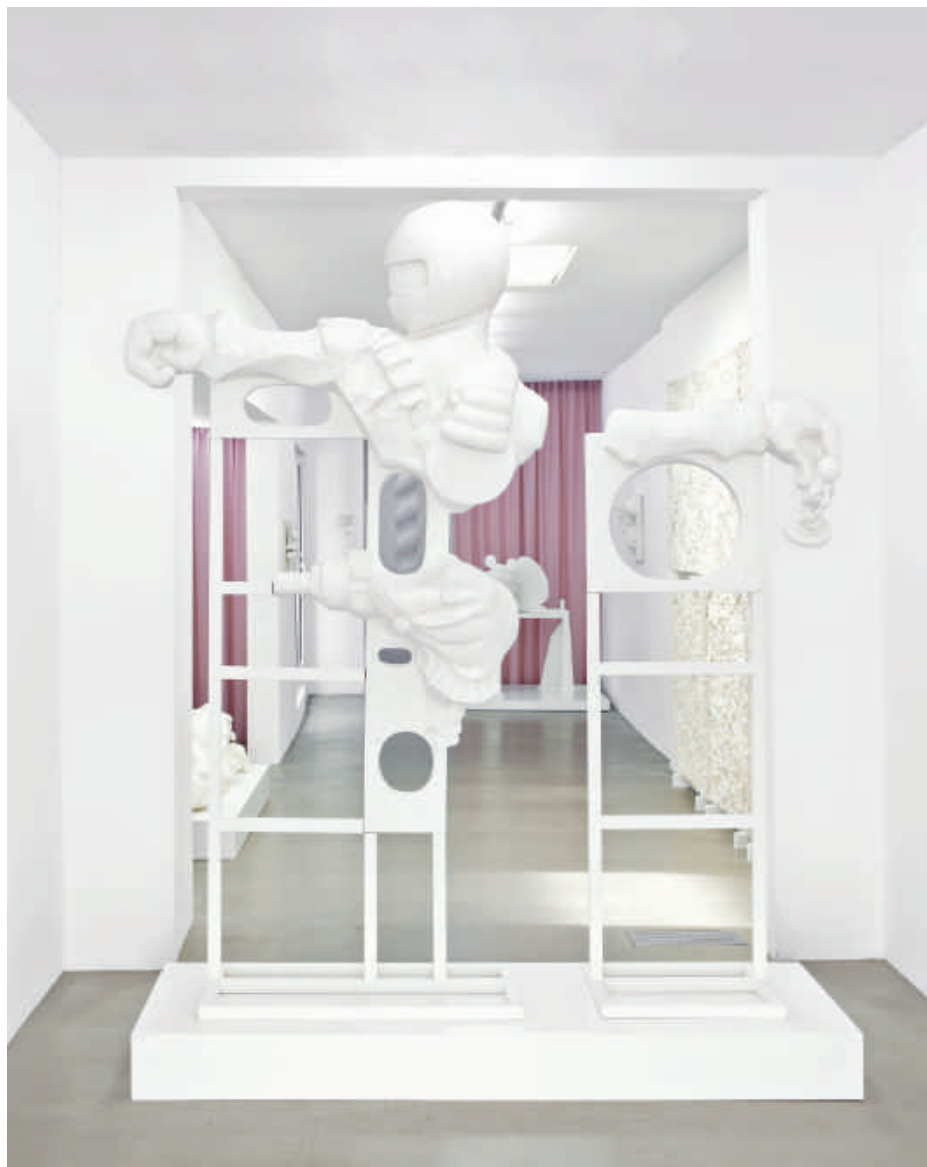
Nadia Naveau, Let's Play it by Ear (detail uit installatie), 2020 Acrylic One, gips, staal, textiel