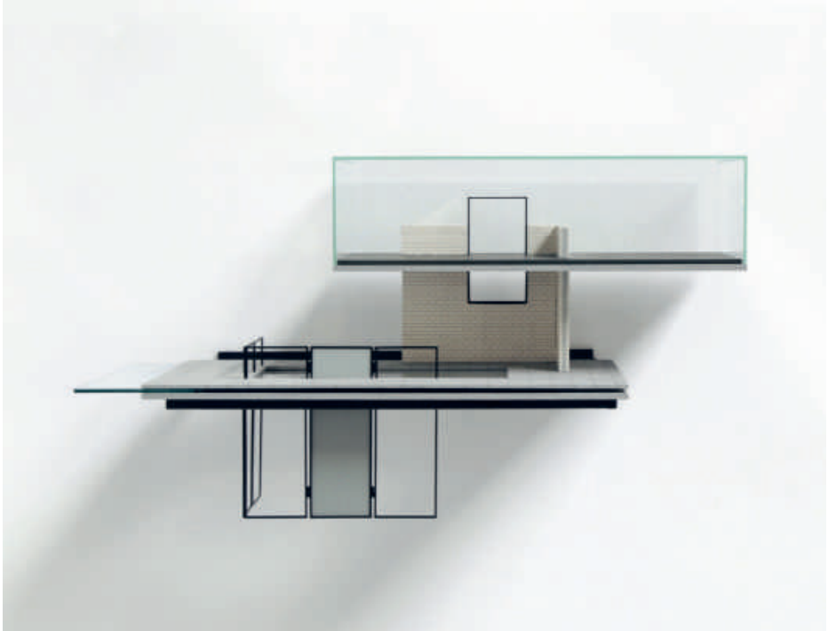
Caroline Van den Eynde, Whispers in the lake house , 2017 Staal, glas, messing, verf, hout | 50 x 63 x 30 cm