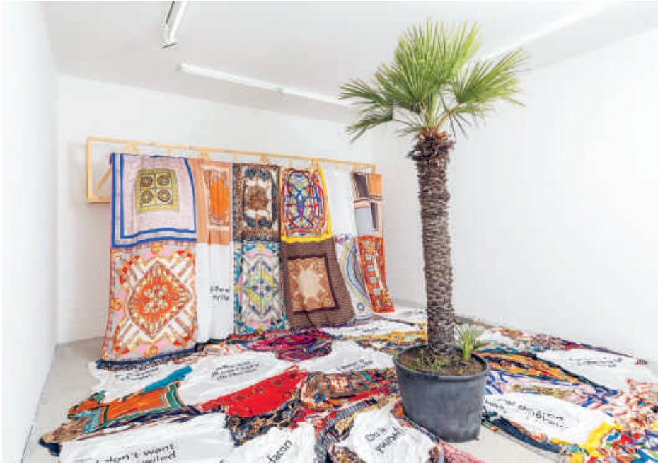
Mehdi-Georges Lahlou, From the Balcony, 72 Virgins and the Oasis , 2020 Hout, palmboom, zijde (moslimsluiers), ventilators, geluid (Sound scape by Ève Ganot) variabele afmetingen | Met de steun van Maison d'Art Actuel des Chartreux (MAAC), Brussel