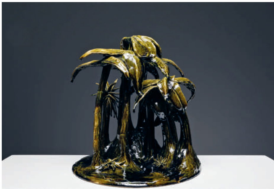
Daan Gielis, Tintin's Jungle I , 2021 Keramiek, glazuur | 36 x 31 x 31 cm