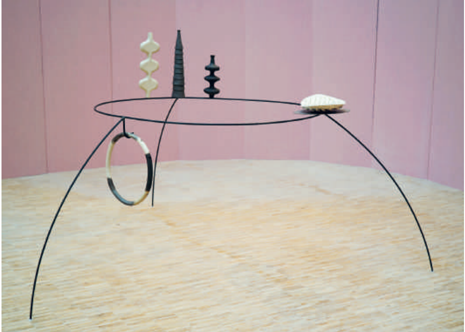
Maika Garnica, Bounce, interfere , 2021 Keramik, metaal