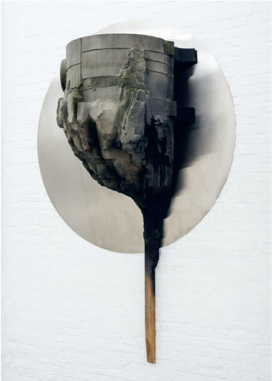
Katleen Vinck, Het Aardmassief , 2019

Hout, staal, aluminium, acrylhars, PU, cement, epoxy, verf | 150 x 250 x 75 cm