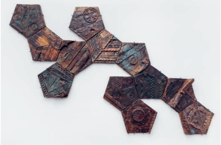
Marius Ritiu, Global Citizen , 2017 gerecycleerd manueel gesneden hout, gerecycleerde manueel gehamerde koperplaat | 571 x 365 x 45 cm