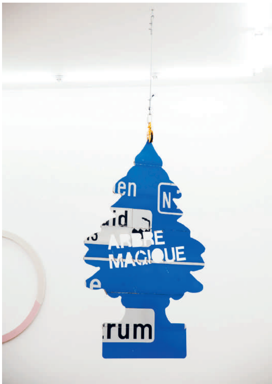
Karl Philips, Arbre Magique , 2016 Aluminium, verkeersbord | 206 x 103 cm