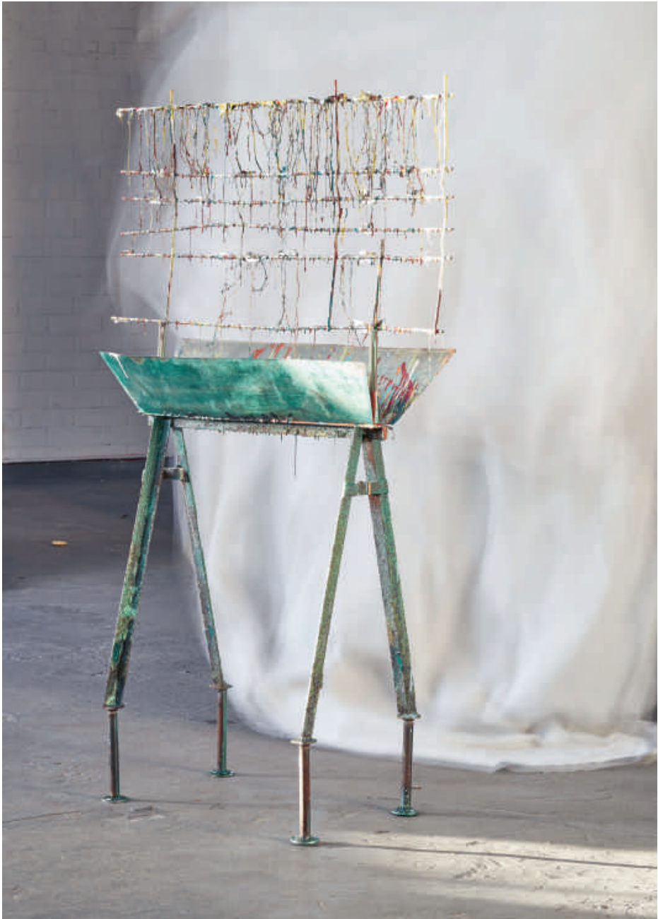
Willem Boel, Pare feu #43 , 2020 IJzer, jute, verf / 159 x 100 x 40 cm | (foto: Alwin Vyvey)