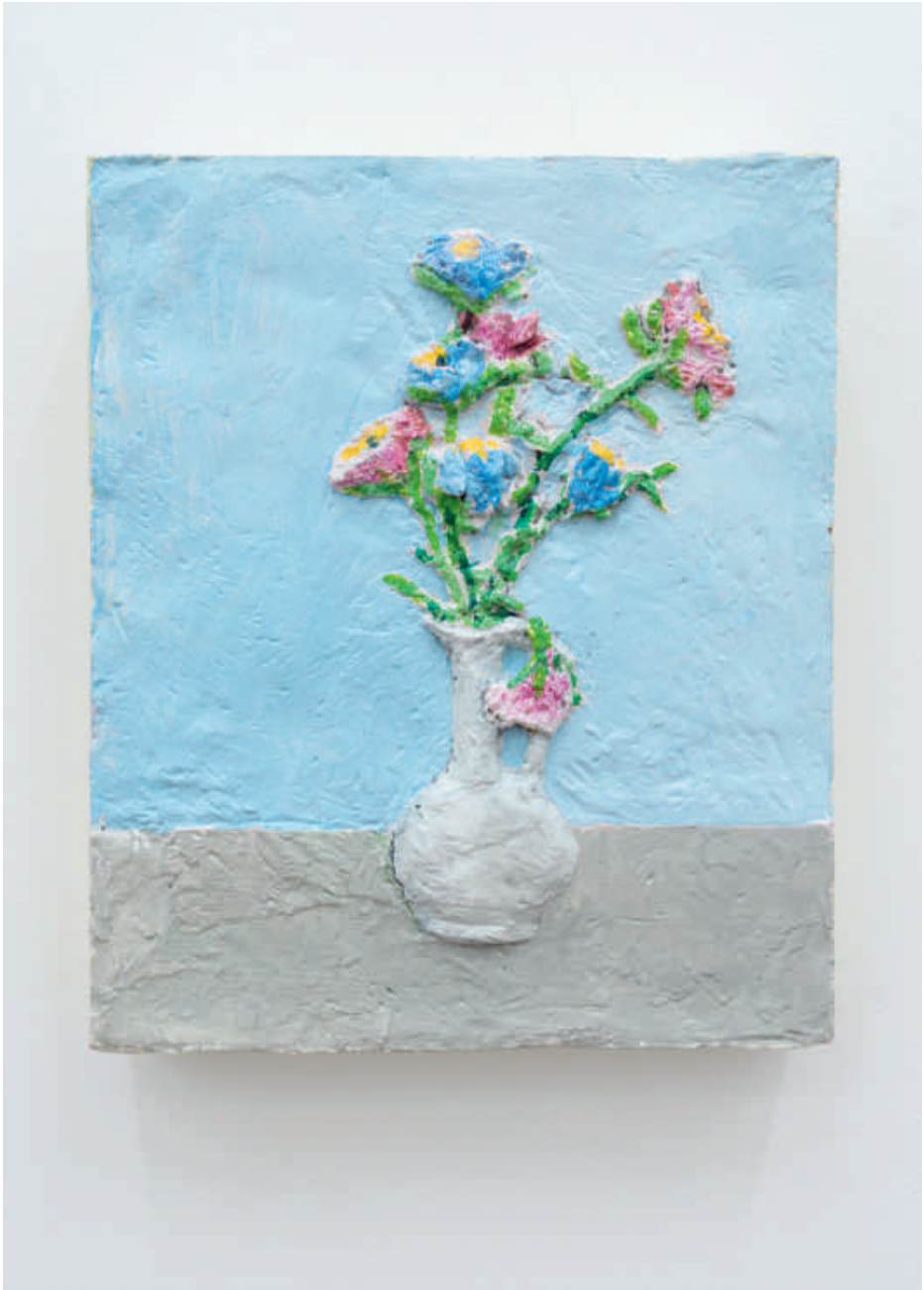
Yannick Ganseman, Flowers , 2018 Beschilderd gips | 28 x 23,5 x 4 cm