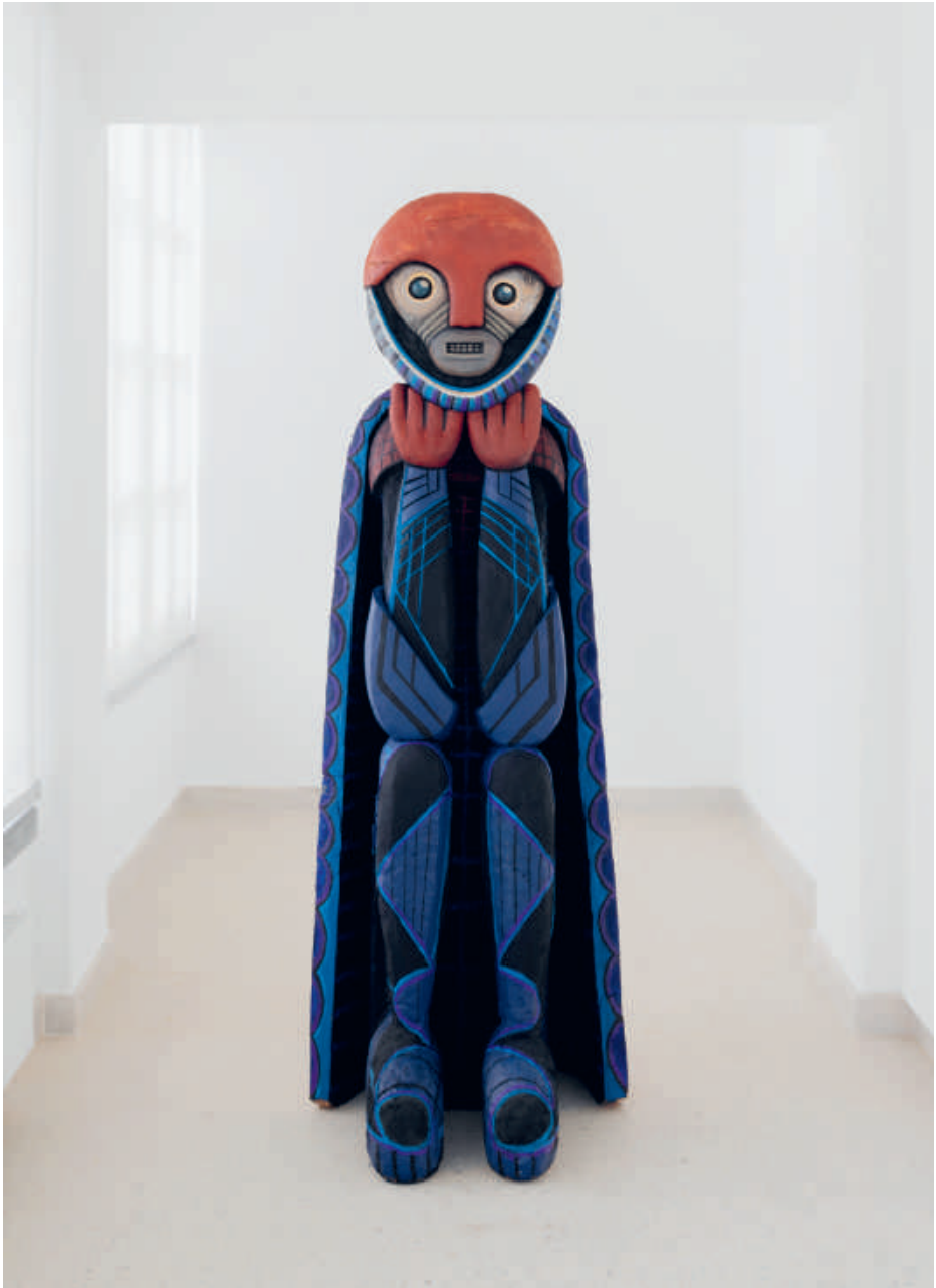
Warre Mulder, When times are strange and things are compelled to be rearranged... transformer must change , 2020 | Hout, epoxy, verf | 210 x 75 x 71 cm