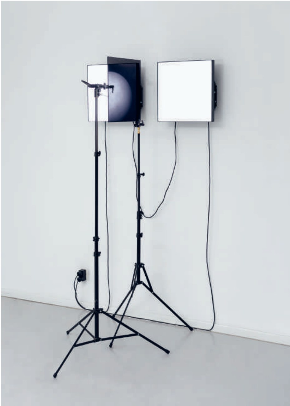
Emmanuel Van der Auwera, VideoSculpture XXI (Vegas) , 2019 2 LCD screens, polarization filter, plexiglass, 2 tripods, cables, HD video | 12 mins 40 secs | 181 x 96 x 75 cm